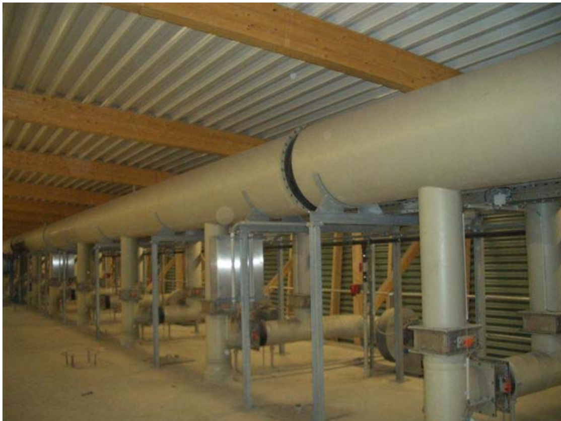
Umluftsystem DN 350 mit Ab-und Zuluftleitungen DN 1000