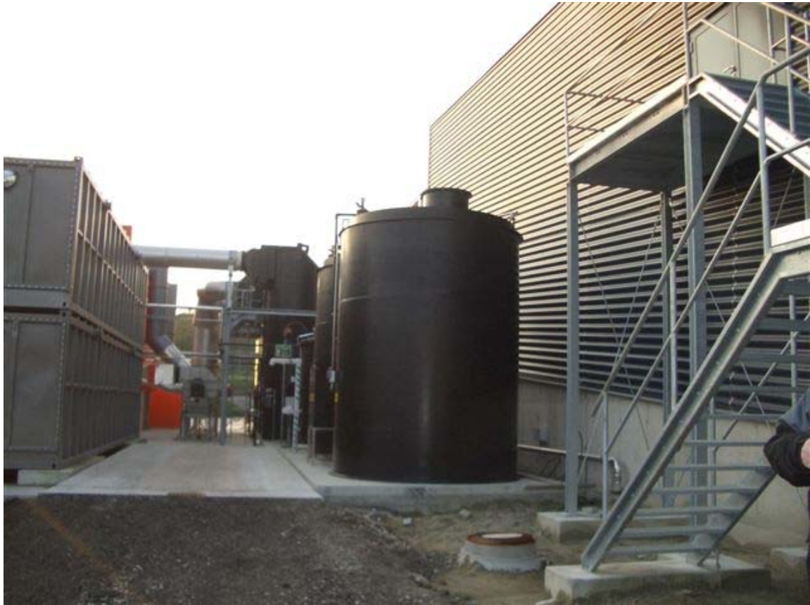
PE-HD-Ammoniumsulfatspeicher, doppelwandig, V = 30 m³, DN 3000, H = 4700 mm