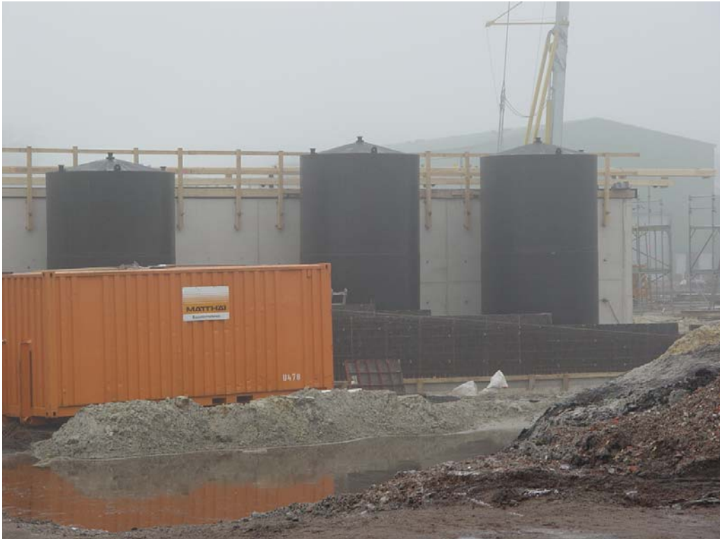
PE-HD-Prozess- und Brauchwasserspeicher V = 35 m 3 , DN 3000, H = 5500 mm

Mit folgenden Bildern während der Montagearbeiten möchten wir unseren Leistungsumfang darstellen: