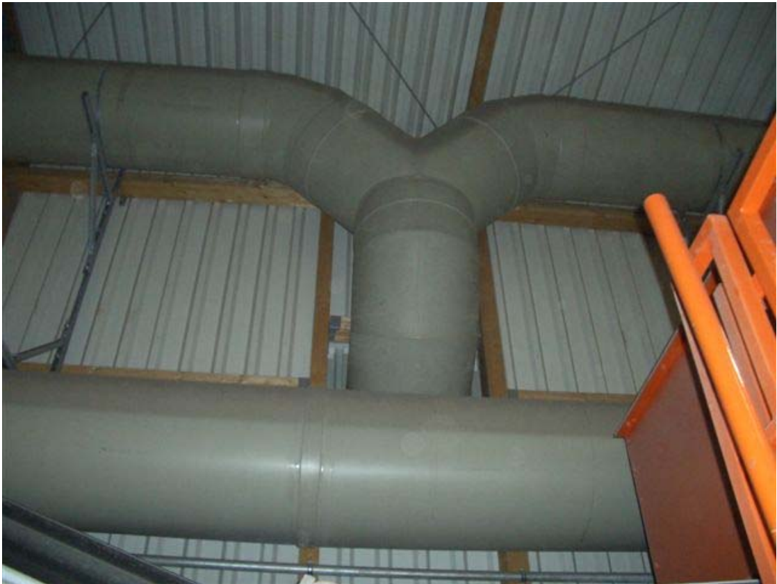
Sammler DN 900 Tunnelreihen Ost/West zur Abluftreinigung