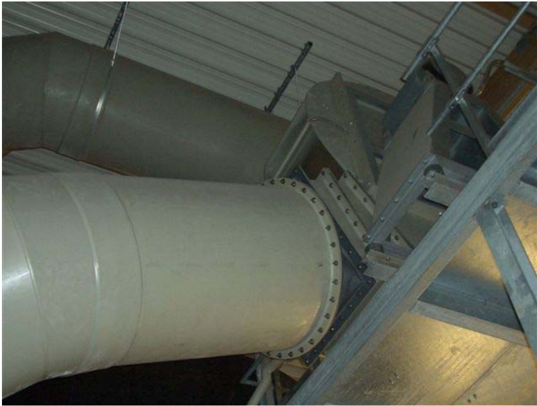
Abluftventilator auf Tunneldach Ost mit Abluftleitung DN 900