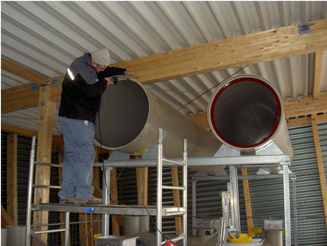
Ab-und Zuluftleitungen DN 1000