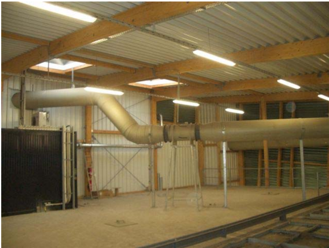
Abluftleitung Tunnelvorhalle DN 700 als Frischlufteinspeisung zum Umluftsystem