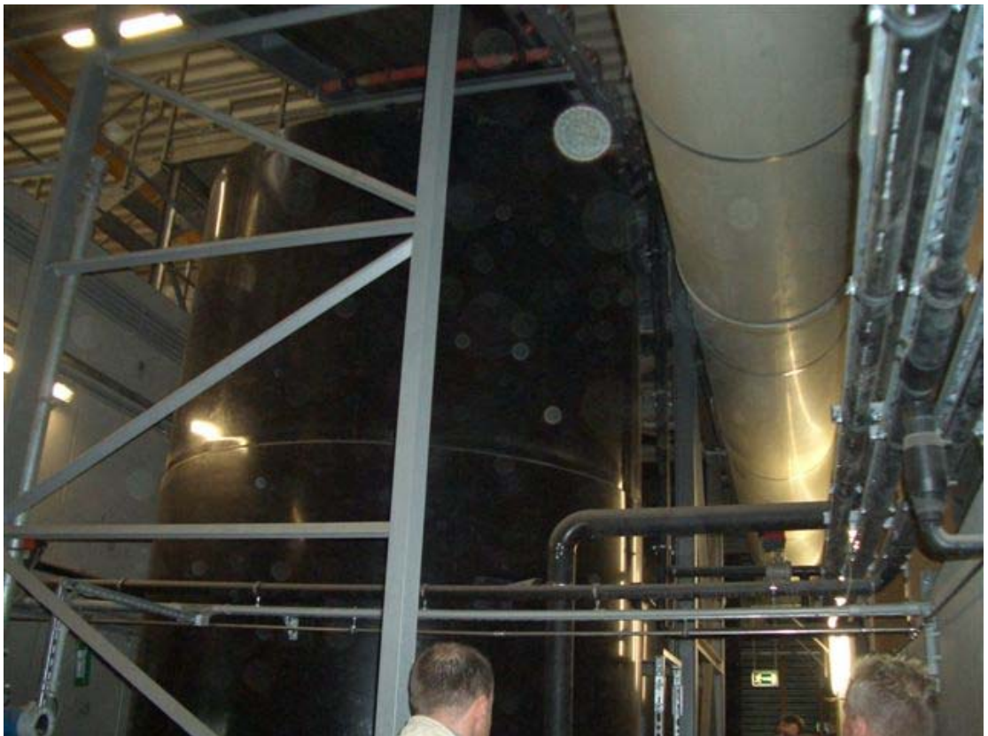
Südgang – Wassertechnik und Lüftungsleitungen DN 900 zur Abluftreinigung